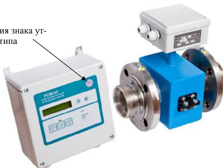
Рисунок 1 - Внешний вид РСМ-05.03 и РСМ - 05.03С, РСМ - 05.03СМ

Место для нанесения знака утверждения типа