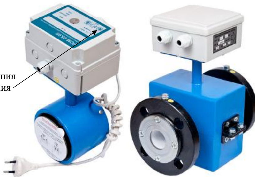
Рисунок 2 - Внешний вид РСМ-05.05 и РСМ-05.05С, РСМ - 05.05СМ, РСМ-05.07, РСМ - 05.07М

Место для нанесения знака утверждения типа