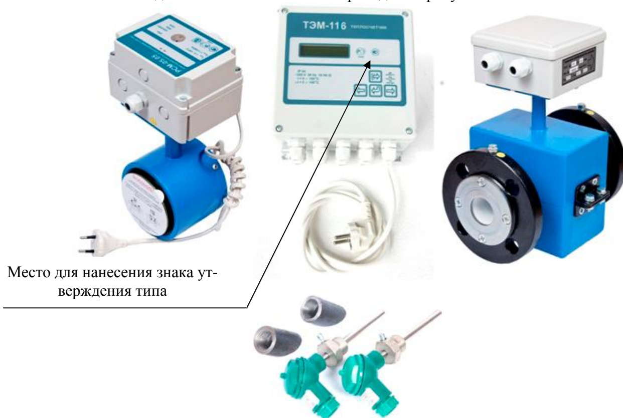
Рисунок 1 – Внешний вид теплосчетчика ТЭМ-116

Внешний вид теплосчетчика ТЭМ-116 приведен на рисунке 1.